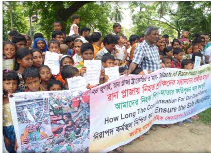
Demonstration der Waisenkinder am 24.7.2013, organisiert von der Gewerkschaft NGWF

Die meisten Unternehmen – mit Ausnahme von C&A - haben keine Entschädigungsleistungen an die Opfer und Hinterbliebenen geleistet. Damit ignorieren sie die ILO-Konvention 121, nach der sie die nötigen Entschädigungszahlungen für medizinische Kosten und Lohnausfälle an die Opfer und Hinterbliebenen des Brandes zahlen müssten.