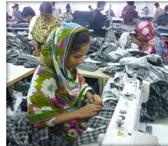
Textilfabrik in Dhaka