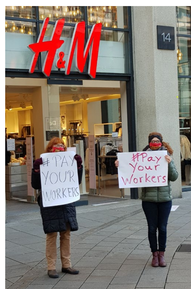
#payyourworkers-Aktion in Stuttgart

Einmal im Jahr treffen sich Aktivist*innen, Multiplikator*innen sowie Interessierte der Kampagne für Saubere Kleidung, informieren sich über die aktuellsten ARBEITSBEDINGUNGEN IN DER GLOBALEN MODEINDUSTRIE und probieren sich in verschiedenen Aktionsformen aus. Im Fokus stehen dabei die Fragen: Wie machen wir andere auf die desaströsen Arbeitsbedingungen von Textilarbeiter*innen aufmerksam? Was fordern wir von Modeunternehmen und Politiker*innen?