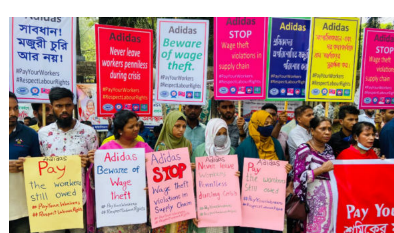
#payyourworkers-Protest in Bangladesch

Ob Neueinsteiger*in, Aktivist*in oder langjährige Verfechter*in,