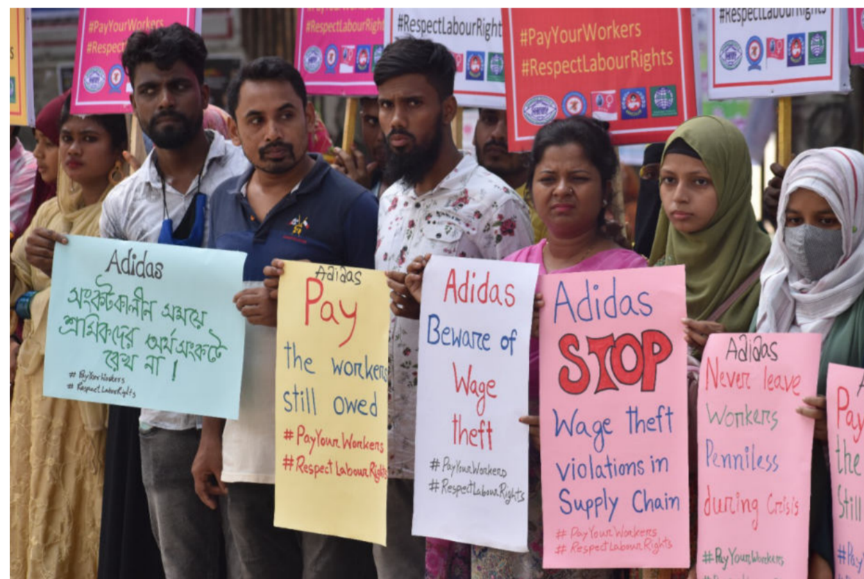
#payyourworkers-Protest in Bangladesch

Die Kampagne für Saubere Kleidung (Clean Clothes Campaign, kurz: CCC) ist ein Netzwerk, das sich für die Arbeiter*innen in den Lieferketten der internationalen Modeindustrie einsetzt. Wir wollen eine Verbesserung der Arbeits-, und Lebensbedingungen für die Beschäftigten in der Bekleidungsindustrie weltweit vorantreiben.