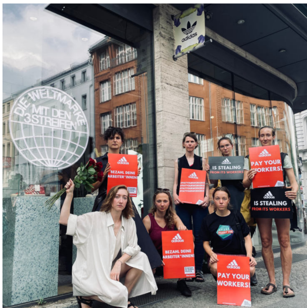
#payyourworkers-Aktion in Berlin

Auch in dem Jahr, in dem sich das größte Unglück der modernen Textilindustrie, der Einsturz des Rana Plaza Gebäudes in Bangladesch, zum 10. Mal jährt, lädt die Kampagne für Saubere Kleidung – natürlich – alle zum Aktionstreffen ein, die in ihren Regionalgruppen oder anderswo für Arbeitsrechte in der Mode aktiv werden wollen: